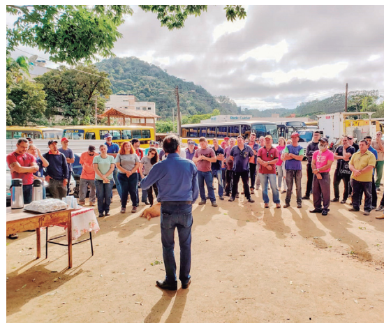
Os servidores são o impulsionamento da Prefeitura