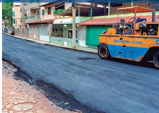
Capeamento asfáltico nos bairros Jardim da Montanha, Dois Pinheiros e Alvorada