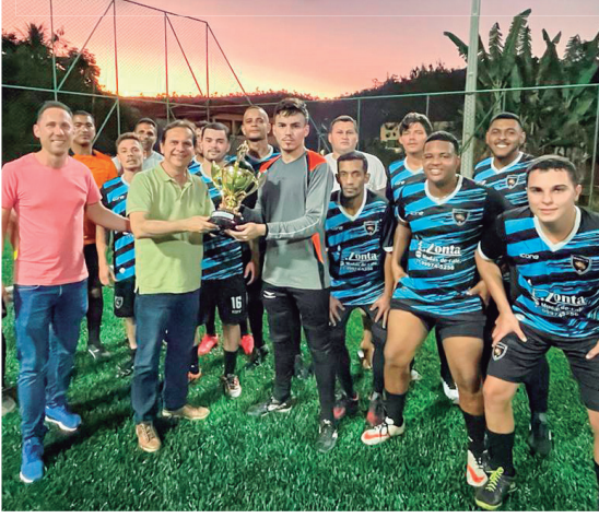
Construção de campo society e revitalização da Praça do Loteamento Colibri, em Santo Antônio do Canaã