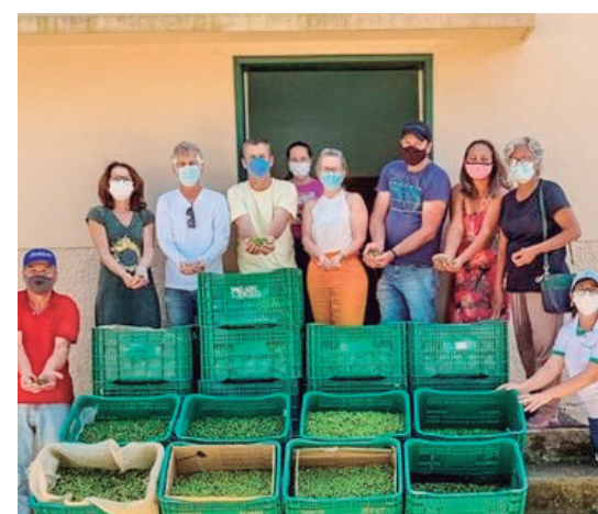
Primeiro azeite genuinamente capixaba

E ainda: Prêmio Piarte, Concurso Cultural Cooperar para Transformar (Sicoob), 386 atendimentos pelo Pronaf, fortalecimento da produção e comercialização de produtos hortigranjeiros e Plano de Agricultura de Baixo Carbono