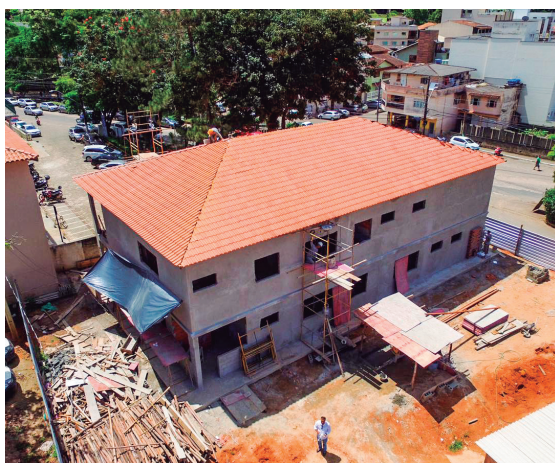
Construção do CREAS