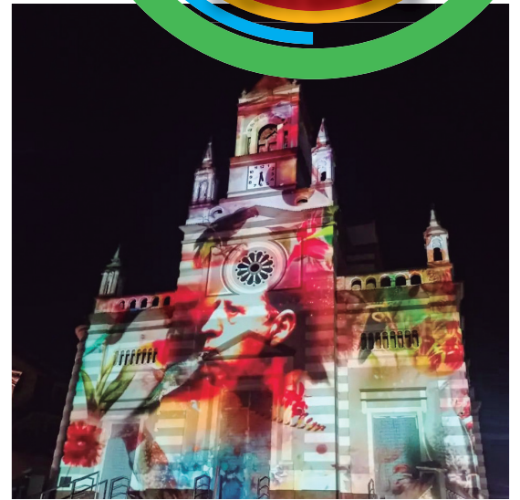
Festival de Cinema