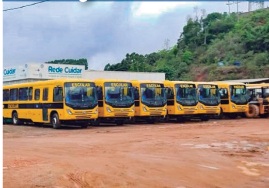
12 ônibus escolares