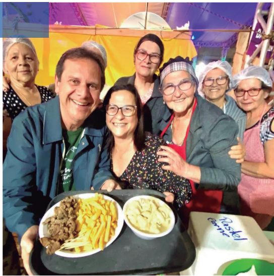
Festa do Imigrante