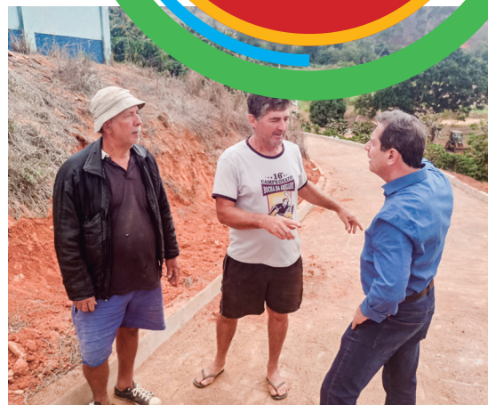
Calçamentos rurais no Milanesi, Córrego Seco, Alto Várzea Alegre e Tabocas