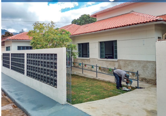
Unidade de Saúde Básica em São João de Petrópolis