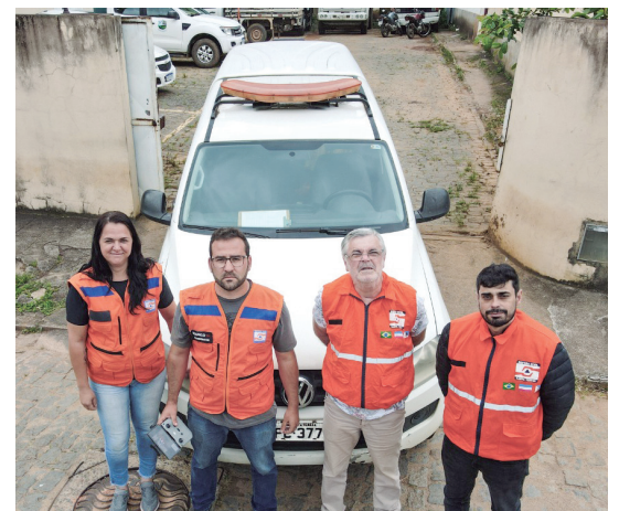
A Defesa Civil é essencial para o município