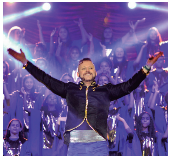
Musical de Natal