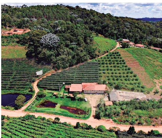
Caminhos do Campo Circuito Caravaggio (contrato assinado)