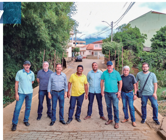
Duas pontes em Várzea Alegre e outras 7 pontes pelo município

Muito mais: Entregues em 2022 - Reforma da Policlínica e do parquinho da Nonna Cizela. Obras em andamento - EMEF Prof. Ethevaldo Damázio, EMEIEF Prof. Hausler, EMEI Emilinha, reforma e ampliação da EMEIEF Sebastião José Pivetta, reforma e muro de contenção da EMEI Peçanha Póvoa e reforma da EMEIEF Paulino Rocon (com recursos municipais, estaduais e federais).