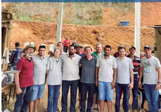
Galpão, trator e equipamentos para Baixo Tabocas