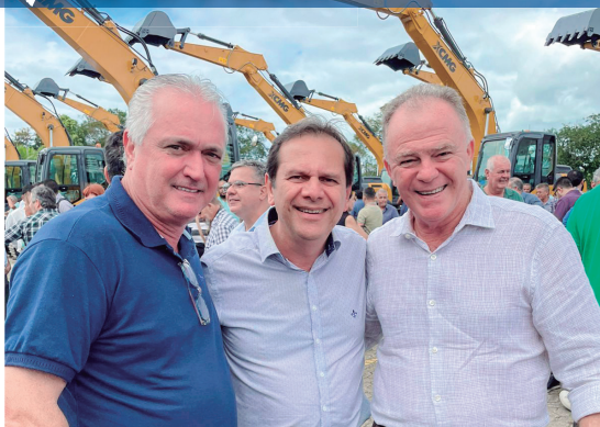
Santa Teresa recebeu escavadeira do Governo do Estado