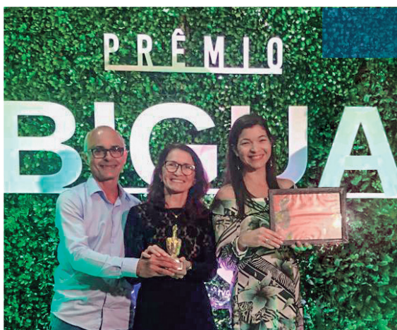
Prêmio Biguá - Projeto Barraginhas Prêmio Inovés - Orgânicos em Foco