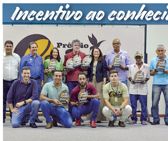
Prêmio Cafés Especiais 9 produtores ganharam o prêmio em 3 categorias

Destaque dos projetos Calendário de Estações - Buona Pasqua, Stagione Invernale, Primavera Teresense e Encantos de Natal. Projeto Barraginhas - executou 9.530 metros de cochinhos e 26 barraginhas em 11 propriedades rurais. Orgânicos em Foco - atendimento a 28 produtores rurais.