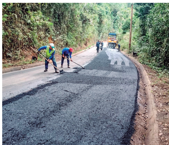
Recapamento na estrada de Aparecidinha (finalizado)