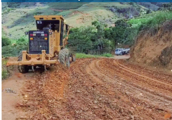
Manutenção e cascalhamento em várias estradas