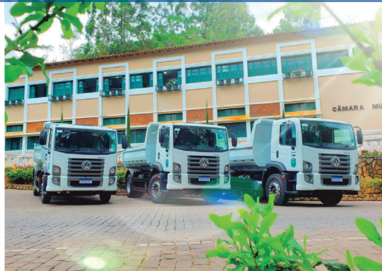
3 caminhões toco