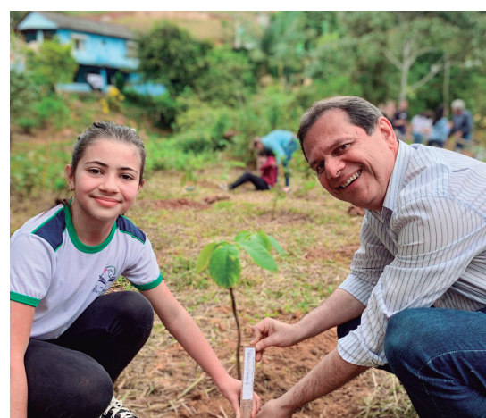
Dia da Árvore

Ajudando a natureza: Aquisição de contentores para recolhimento do lixo seco e reciclável (Agenda 2030 - Plano de Ação Global) e aquisição de lixeiras e PEVs para coleta seletiva (licitação em andamento).