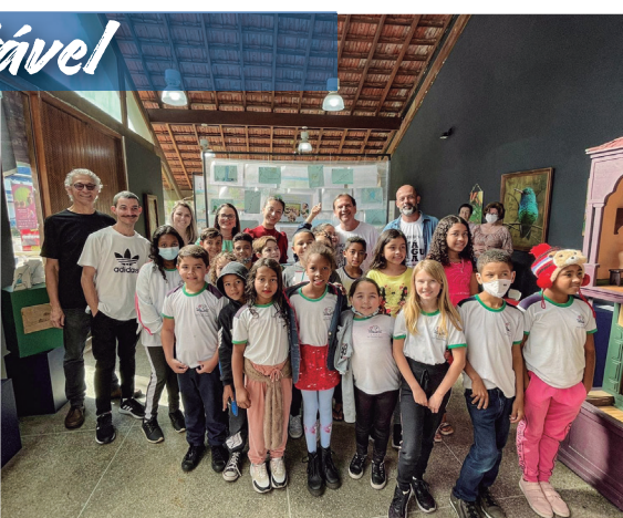
Águas da Mata Atlântica