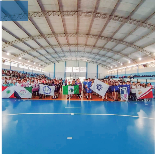
Jogos Estudantis de Santa Teresa, capoeira, futebol, futsal, corrida, futvôlei, passeio ciclístico, handebol, karatê e jiu-jitsu