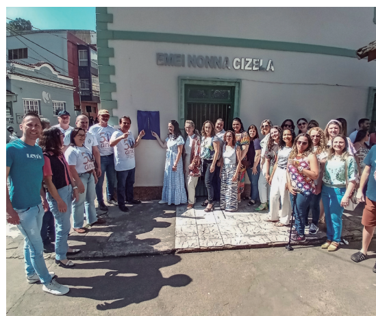
EMEI Nonna Cizela