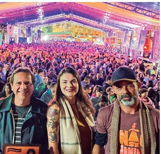
Festival de Cerveja