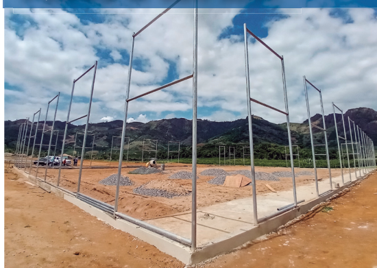
Aquisição de duas áreas em Várzea Alegre para a construção de campo society e praça