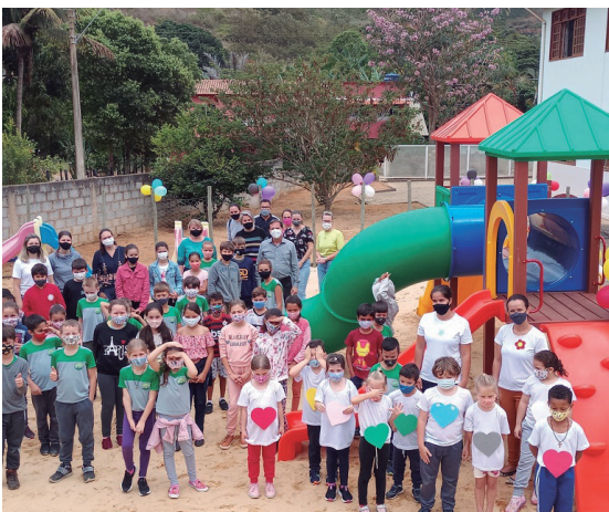
As crianças são o futuro de nossa cidade