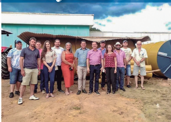
Secador de café para 15 de Agosto