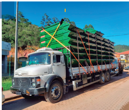
40 novas caçambas