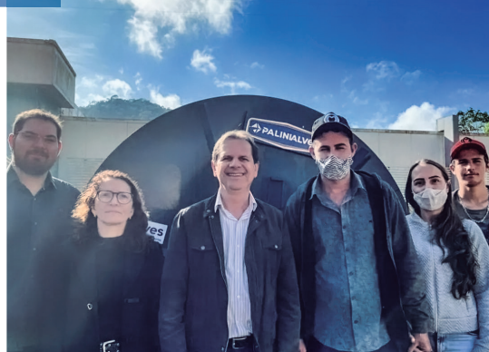
Secador de café para Família Valt

E tem muito mais: Caminhos do Campo de 25 de Julho a 15 de Agosto (edital publicado), 4 veículos utilitários, 2 escavadeiras hidráulicas, 1 caminhão pipa, 1 van de transporte sanitário, 1 ambulância, 1 retroescavadeira, 1 caminhão truck, 65 bueiros construídos e 15 com reparos, cerca de 4 mil km de manutenção em estradas e mais de 120 limpezas de carregadores de café.