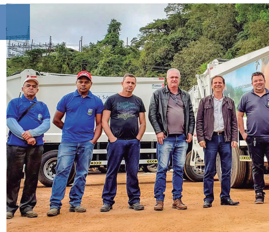
2 caminhões de resíduos sólidos