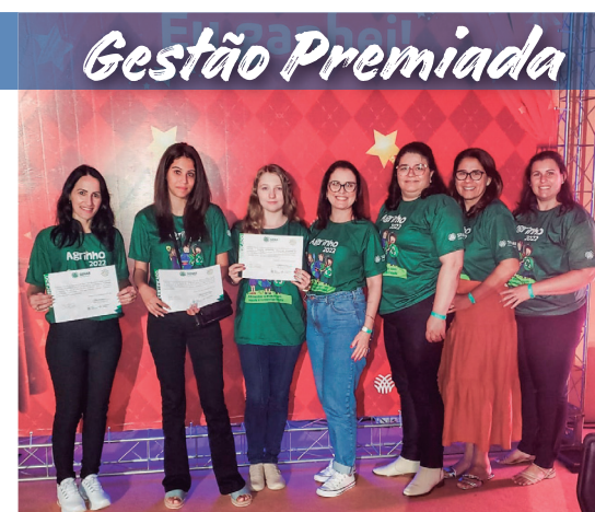
Estudantes premiadas no Programa Agrinho 2022

Destaque dos projetos Calendário de Estações - Buona Pasqua, Stagione Invernale, Primavera Teresense e Encantos de Natal. Projeto Barraginhas - executou 9.530 metros de cochinhos e 26 barraginhas em 11 propriedades rurais. Orgânicos em Foco - atendimento a 28 produtores rurais.