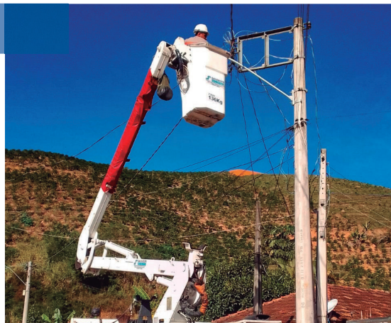
Extensão da Rede de Iluminação Pública em 25 de Julho, Santo Antônio do Canaã e Barracão