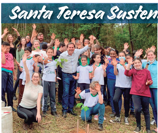
Em parceria com o Ifes, foram distribuídas 1920 mudas

E ainda: Prêmio Piarte, Concurso Cultural Cooperar para Transformar (Sicoob), 386 atendimentos pelo Pronaf, fortalecimento da produção e comercialização de produtos hortigranjeiros e Plano de Agricultura de Baixo Carbono