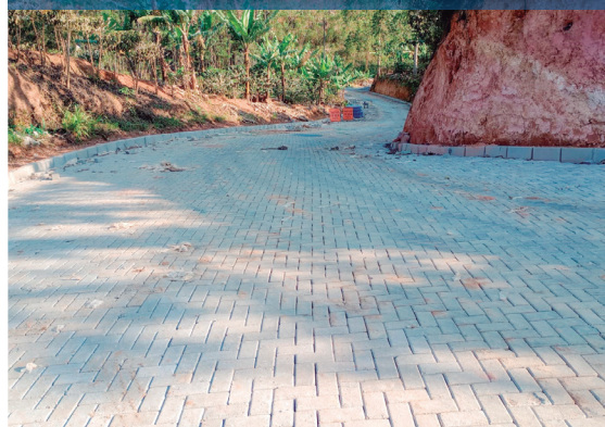
Calçamentos rurais em Serra dos Pregos, Serra dos Peroni (Lombardia) e Córrego Frio