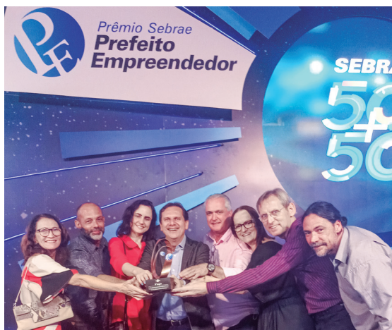
Prêmio Sebrae Prefeito Empreendedor - Calendário de Estações (Turismo e Cultura).