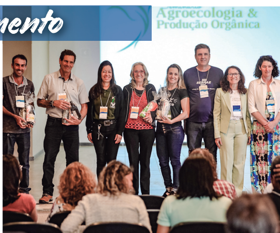
Seminário de Agroecologia e Produção Orgânica